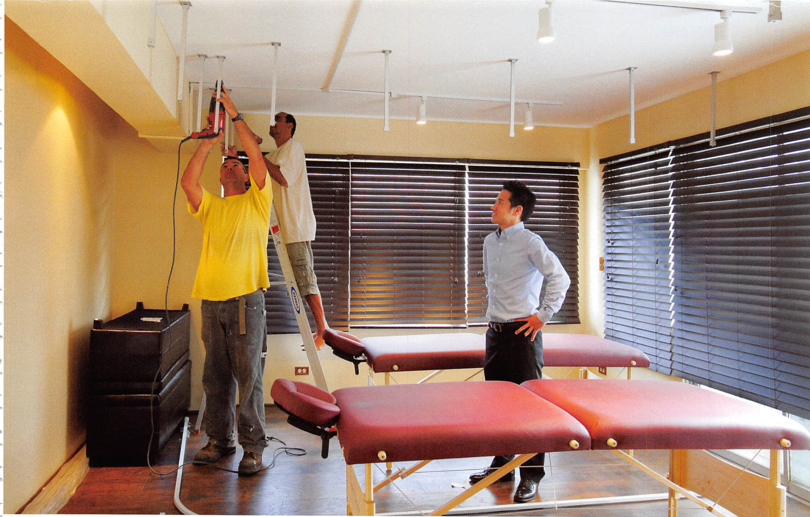
現在は、新事業のロミロミ留学機関「ロミノハワイ・マッサージ・スクール」で、短期ロミロミ留学生が学ぶ場所を準備中だ