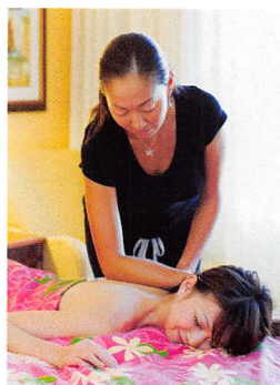
日本人の出張ロミロミは安心して受けられるとリピーター率も高い

ーツに身を包み、朝8時から日付が変わる時刻までオフィスで仕事。趣味はビジネス書を読むこと……と、その暮らしぶりはさながら日本のビジネスマンのよう。ハワイへ移り住んで12年が経つというが、驚くほどハワイ色に染まっていないのだ。