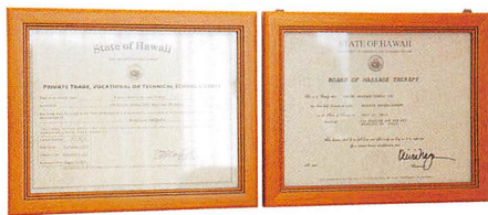
1: 日本人がハワイで働くことを支援する求人サイト「ジョブズモード」も運営。日本の相談者とスカイプで話すこともしばしば 2: スマートフォンとiPadは仕事に欠かせない道具。メモは手書きで書く方がアイデアが浮かぶと、あえてアナログな手法で 3: ハワイ州公認のマッサージライセンス証明書。働くセラピストもライセンス保有のスタッフのみ